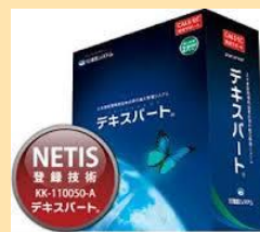
デキスパート シリーズ

電子納品・各種施工管理はもちろん、情報化施工や工事成績UP、電子黒板、ICT対応など土木工事の施工管理業務をトータル的にサポートします。目的に合わせて必要なソフトウェアを組み合わせ、導入することが出来ます。